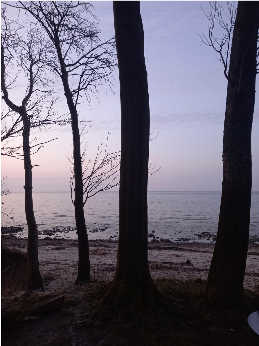
BaumTore zum TanzPlatz am Strand

NaturZeit auf der Ostseeinsel Poel November 2026